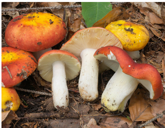
Russula aurea o aurata