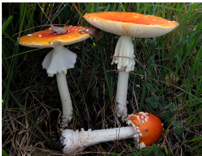
Amanita muscaria var. Helveola

Il Sitta dice che tutto questo è già realtà e crea confusioni, l'uso delle App non può che espandersi in futuro; dice inoltre che sarà una battaglia impari ma la battaglia della prevenzione deve comunque essere fatta; egli spera che tutti i frequentatori dei gruppi micologici, tutti gli addetti ai lavori ed in particolare tutti coloro che hanno maggiore impatto mediatico, facciano tutto il possibile per promuovere la presenza del controllo micologico gratuito presso le USL ed avvisino la cittadinanza di non fidarsi delle App ai fini del riconoscimento delle specie raccolte e della loro commestibilità.