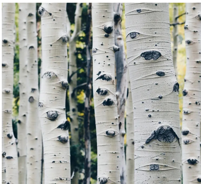
Corteccia di betulla

Un'altra corteccia di notevole interesse è quella della Betulla che è forse quella più decorata che addirittura si trasforma in base allo sviluppo dell'albero; essa è candida, liscia, setosa, segnata da minuscoli trattini neri nella prima fase della vita; in seguito, finisce per spaccarsi lungo linee sottili, in corrispondenza dei "trattini" iniziali per poi sfogliarsi in linee trasversali quando l'albero giunge a maturità. La corteccia ha così assunto il tipico contrasto fra i colori bianco e nero, creando un effetto elegante; la corteccia allora ha perfettamente assolto il suo compito assorbendo umidità nella misura dovuta richiesta dall'albero.